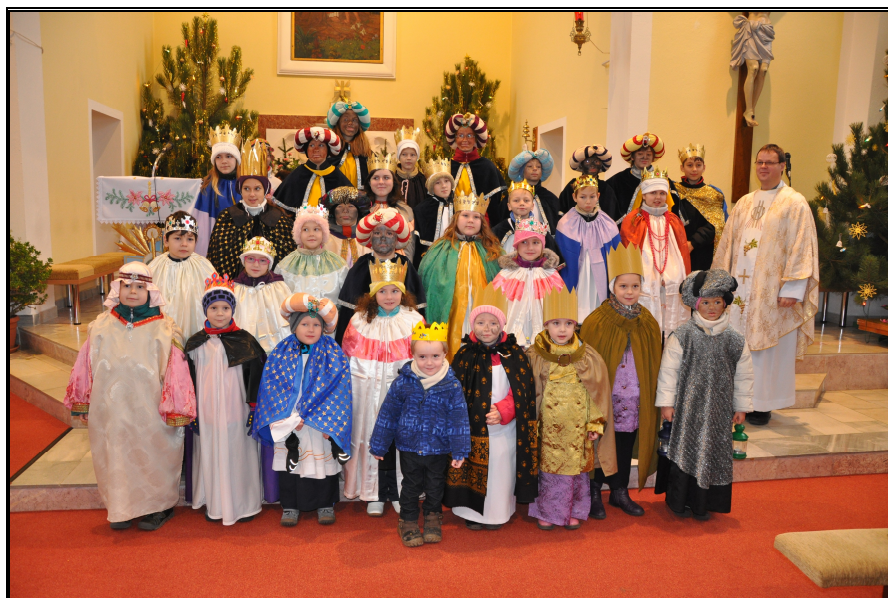
Koledníci ze Tvarožné Lhoty

Odměnou všem koledníkům bylo 3D kino ve Veselí nad Moravou s názvem Happy feet. Kino doslova praskalo ve švech. Na některé poslední zájemce dokonce nezbyly ani brýle, takže podívaná nebyla až tak dokonale zaostřená.