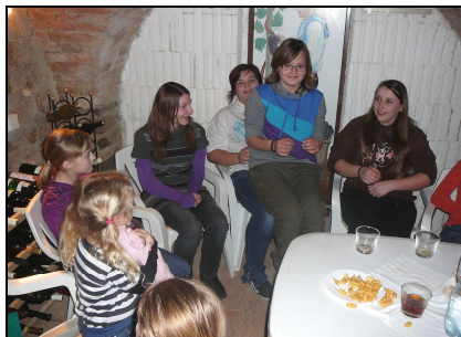
O zábavu se nám postarali otcové a ti neměli chybu!!!