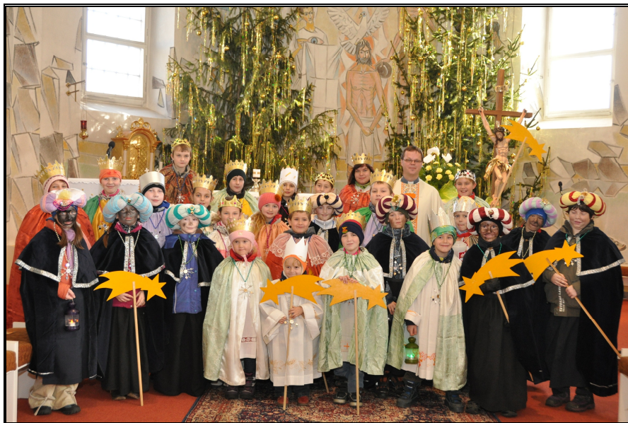
Koledníci z Kněždubu

Ale ještě před samotným koledováním všichni prožili společnou mši svatou. Koledníci si poté vykoledovali něco sladkého a samozřejmě i (z podnětu otce Mirka) něco zdravého na zub.