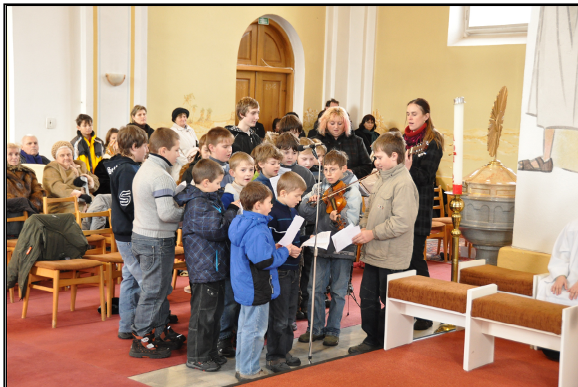
Ale stálo nám to zato!