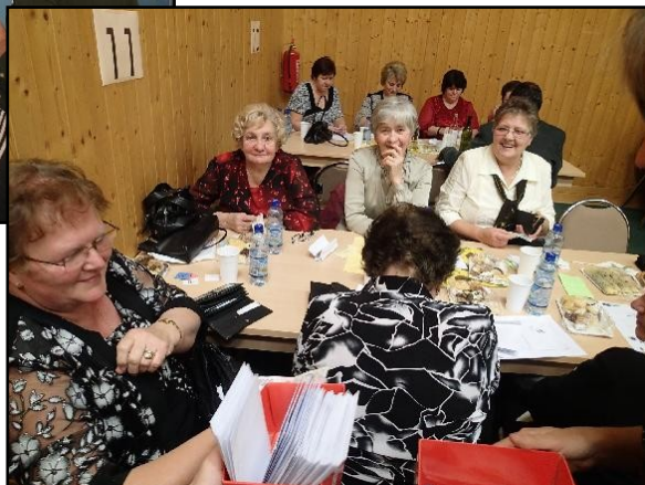
...patenty přichystané k snědku ☺