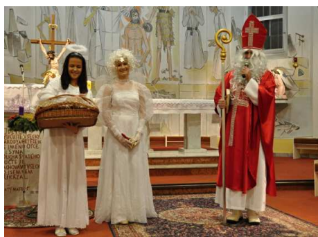
Fotografie z prosince 2015.